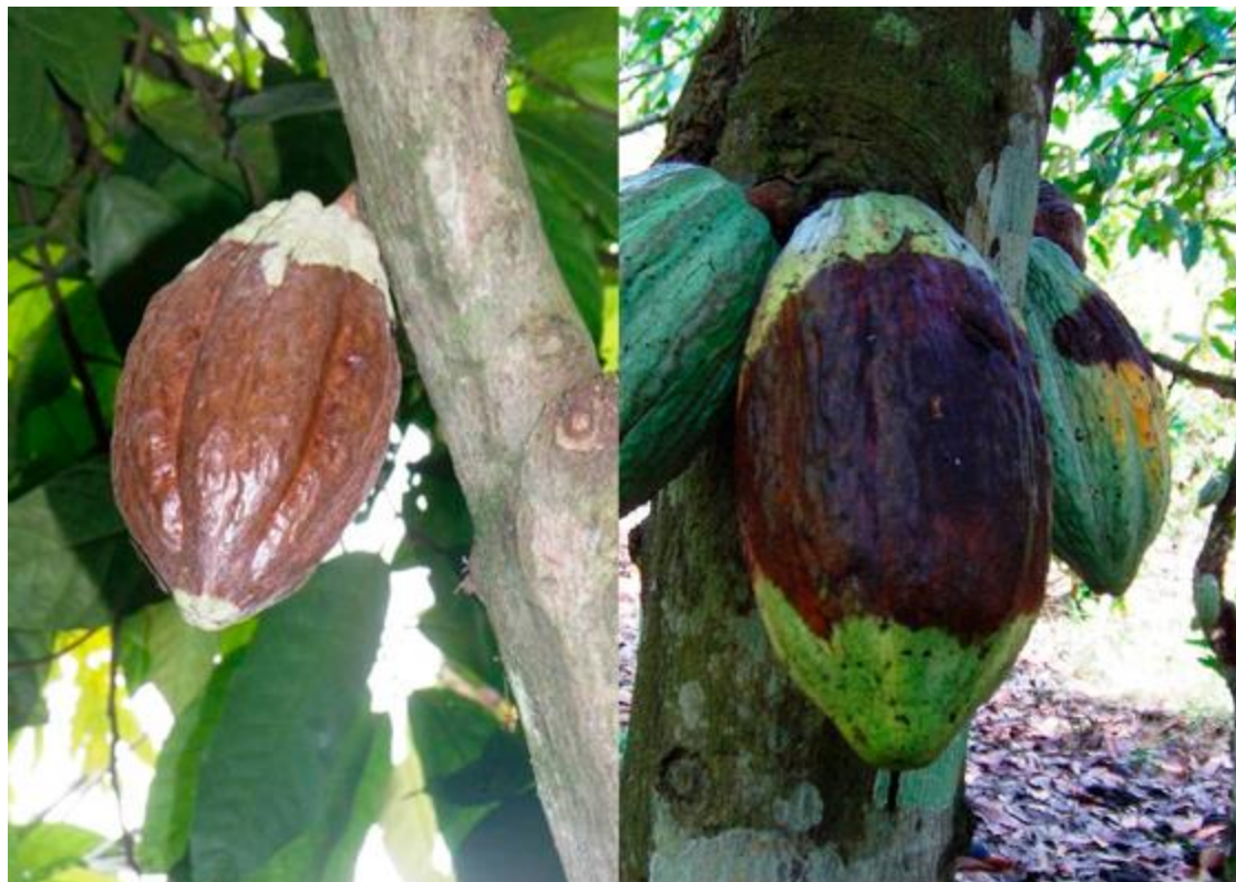
MAZORCAS ATACADAS POR MARCHA PARDA