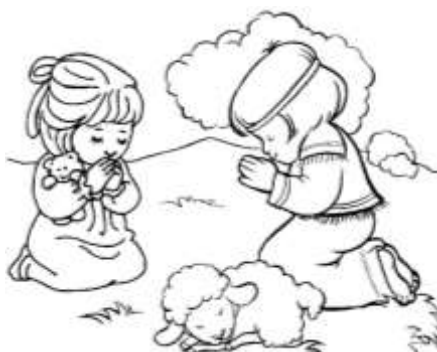
1 Imagen 2